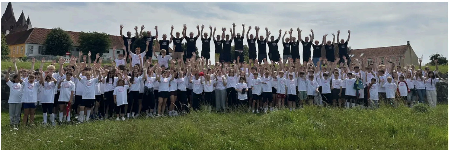
Deltagere, trænere, hjælpere og lejrledere fra DFF's Sommerlejr 2024

Der vil være fægtning på kårde, fleuret og sabel Alle fægtere født i år 2016 eller tidligere inviteres til at deltage