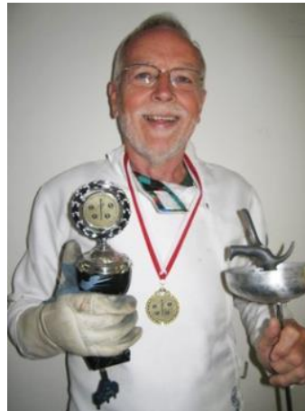
Bronze ved veteran EM