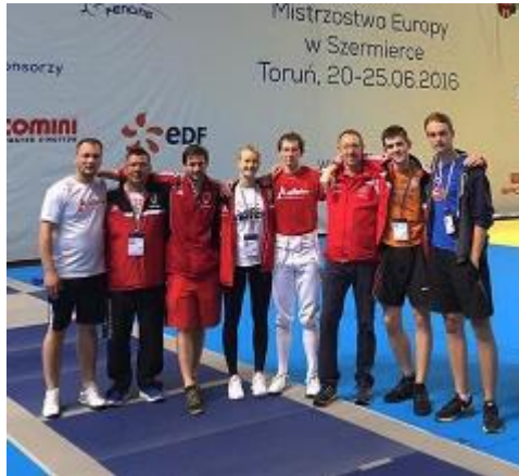
Kårdeholdet nr 6 ved EM