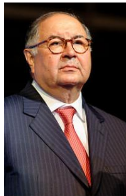
Genvalg til præsident Usmanov