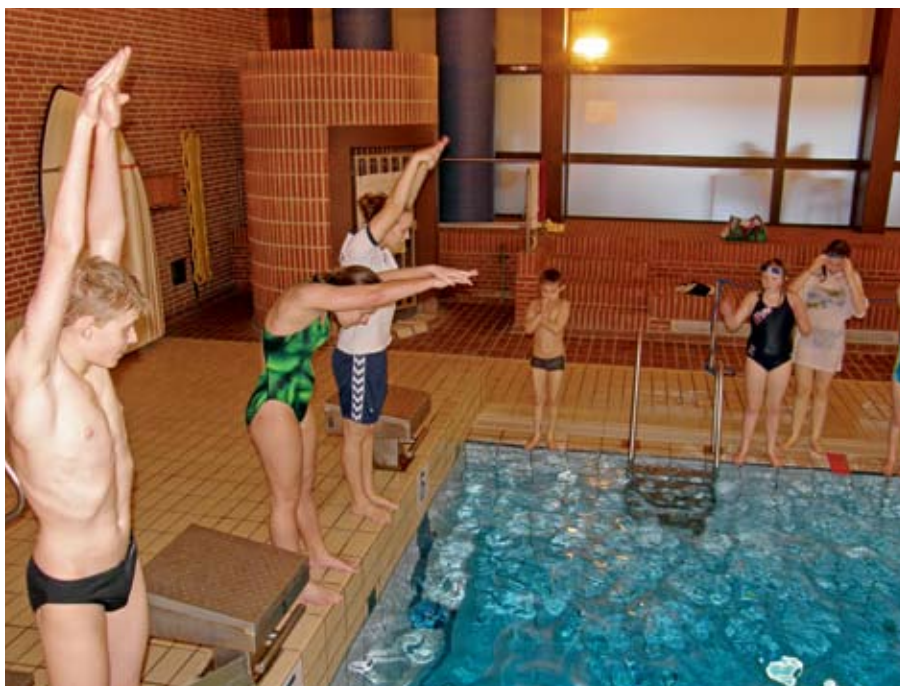
Instruktører i fuld sving under våd weekend.