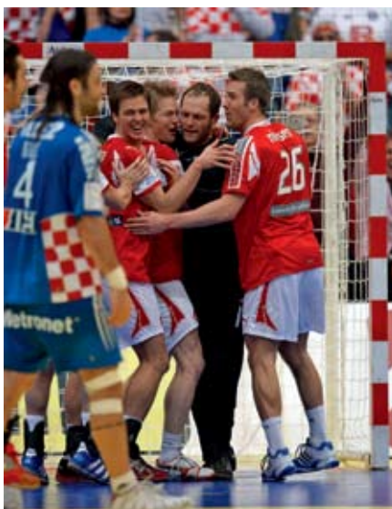
Håndboldherrerne har bidraget med fornyet OL-optimisme.

»Vi ved af erfaring, at vi bliver spurgt meget om det, og så kan vi lige så godt have et svar parat. Vi har også valgt at arbejde med medaljemålsætninger for at ægge lidt til debatten. Det er en god måde at holde OL-gryden i kog på.«