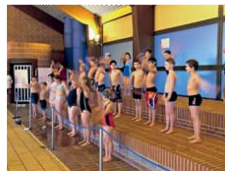
Opvarmningen er i gang hos de små Roskilde-svømmere.