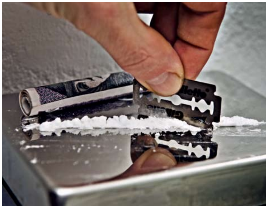
Det her er rykket tættere på sportens verden.

I kølvandet på de mange dopingsager overvejer Danmarks Idræts-Forbund at sætte en kampagne, der skal advare idrætsudøvere mod brugen af blandt andet hash og kokain. <