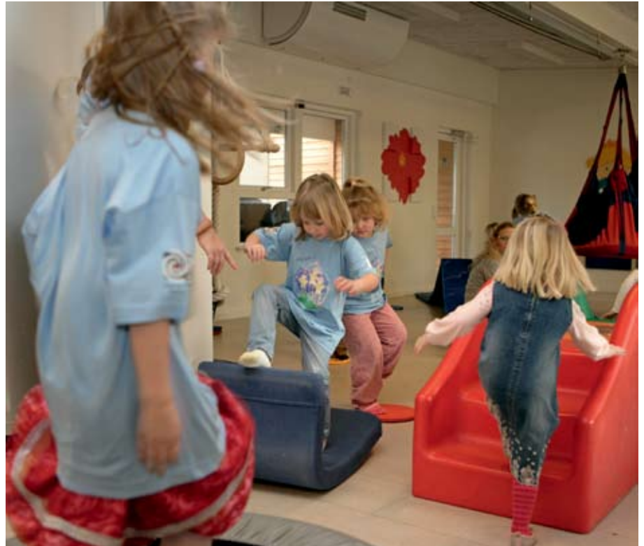
DIF's idrætsbørnehaver er en kæmpe succes. Nu skal konceptet udvides.

Overordnet er tanken bag det nye udviklingskoncept at bibeholde og udvikle børnenes bevægelsesglæde og idrætskulturen ind som en naturlig og sund del af