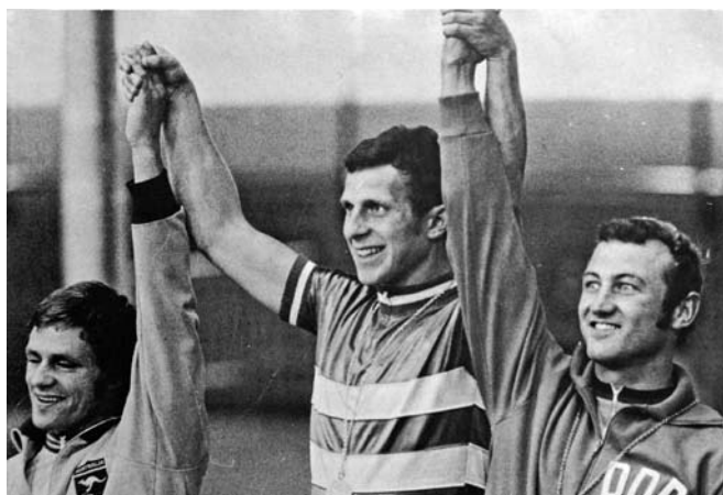
Niels Fredborg var en af de bærende kræfter på den lukningstruede Århus Cykelbane. Her jubler han efter at have vundet guld ved OL i München.