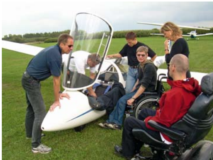
Foreningen Humlebieerne i gang med at gøre et skolefly klar til flyvning.

Et projekt i Vejle Svæveflyverklub og Midt-sjællands Flyveklub under Dansk Svæveflyver Union giver nu handicappede mulighed for at stryge til tops.