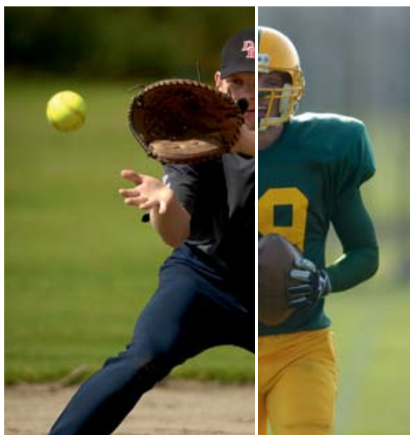
Det er ikke længere så yndigt at følges ad i flere specialforbund.

Et endeligt forslag vil blive behandlet på DIF's årsmøde den 25.-26. april. <