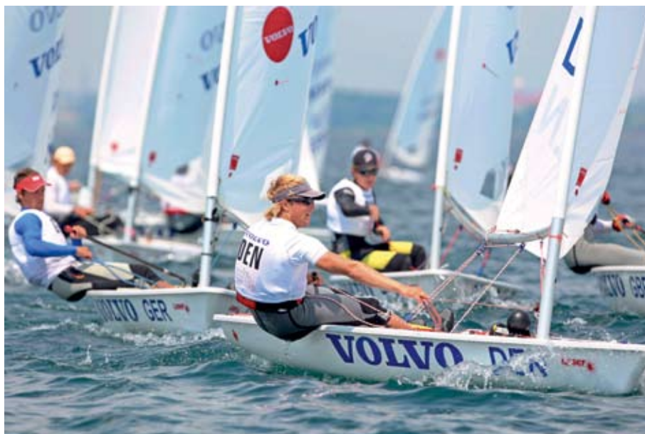
Danmark er klar til sommerens store begivenhed, ungdoms-VM i sejlsport.

»Man skal være tidligt ude og velforberedt. Vi har lavet et meget gennearbejdet tilmeldingsskema, der fortæller, hvad opgaverne går ud på, og vi har en klar og gennemskuelig frivilligpolitik, der skitserer, hvad vi forventer, og hvad den frivillige kan forvente, hvis man melder sig til. Man er som frivillig også medbestemmende, og denne indflydelse er en motivation i sig