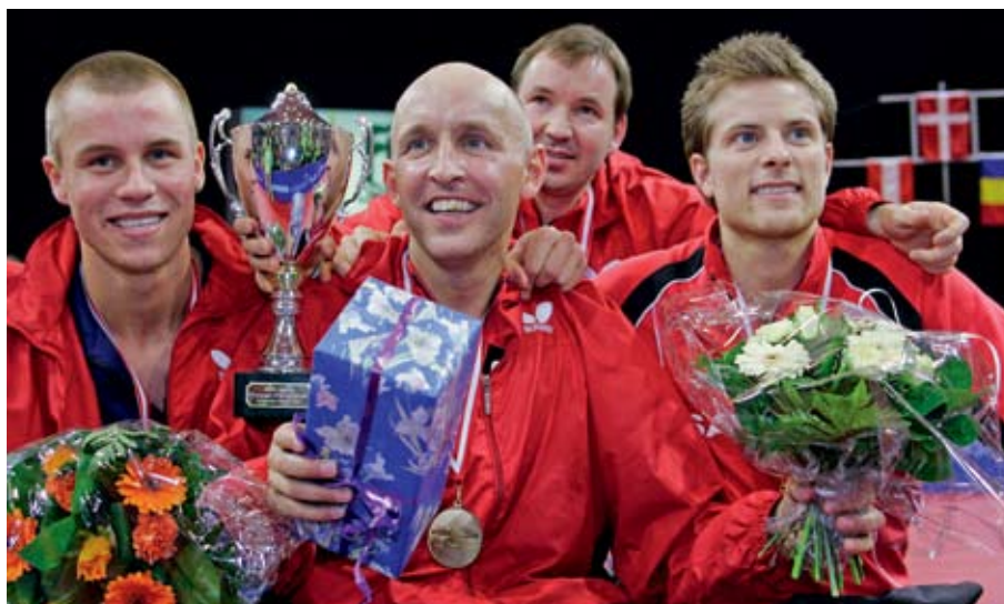
EM-guldholdet samles igen. Nu på et klubhold i Roskilde

På pressemødet i Roskilde blev det samtidig meddelt, at navnet Roskilde kommer til at fremgå på spillertrøjerne i stedet for BTK61, som klubben retteligen hedder. <